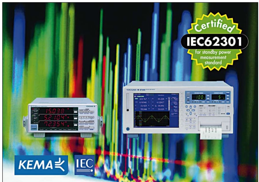
Bild 1: Sowohl die WT210 als auch die WT3000-2A Version von Yokogawa wurden von der KEMA auf ihre Eignung zur Standby Leistungsmessung zertifiziert.