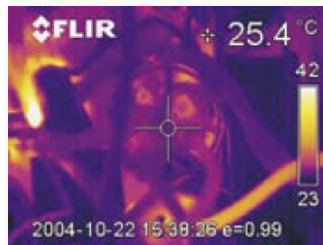
Verbindung in normalem und überhitztem Zustand