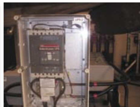
Die Infrarotkamera zeigt den Luftstrom auf einem USV-System unter normalen Betriebsbedingungen