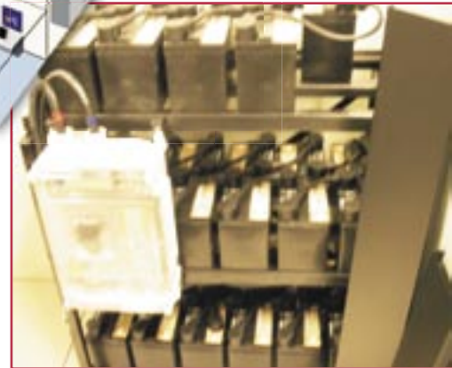
◆ USV-Batteriesatz: eine Batterie muss ausgetauscht werden

Die Kühlung ist für den korrekten Betrieb eines Serverraums von entscheidender Bedeutung: „Noch vor zwei Jahren hatten wir 4 bis 6 Server pro Rack, jetzt haben wir 8 bis 12 Server pro