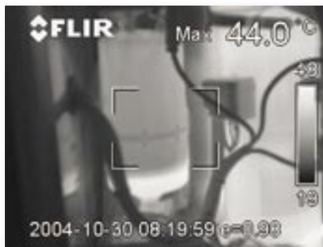
Das Infrarotbild zeigt den Öl- und Wasserstand des Kompressors / Raumbefeuchters

Das im Rechenzentrum des Kunden aufgenommene Bildmaterial muss klassifiziert, bewertet und präsentiert werden. Coromatic setzt das Softwarepaket ThermoCAM ReporterTM zur Erstellung der Berichte für seine Kunden ein. Der Bericht wird im Microsoft® Word® Format erstellt und besteht aus Bildern der untersuchten Objekte in standardmäßigem JPEG-Format, grundlegenden thermografischen Daten und Kommentaren. Johan Andersson betont, dass die Kenntnis der untersuchten Anlagen erforderlich ist, um die Bilder